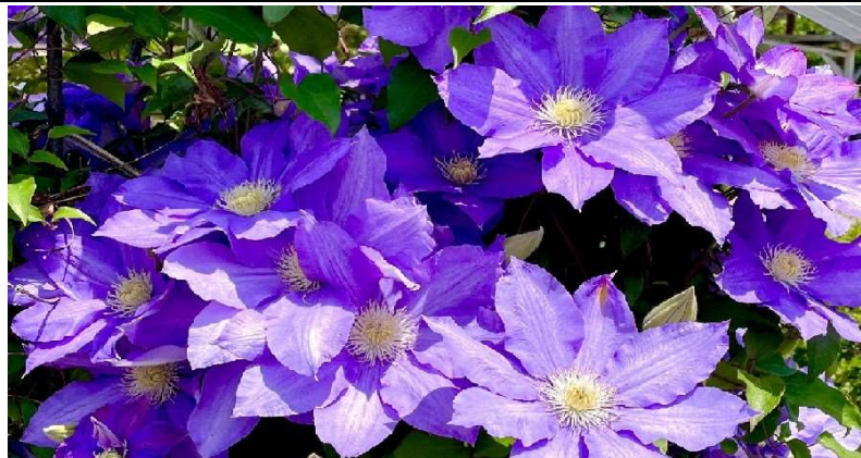
クレマチス(テッセン)⇒

〒277-0835 柏市松ヶ崎 1194-228 Tel070-3791-0150 Fax04-7196-6033 e-mail : fuji1@maru1.co 千葉県社会保険労務士会所属 登録番号 第 12220001 号